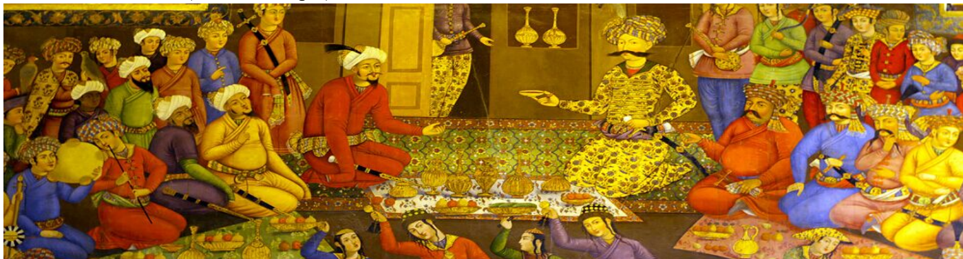
<四十柱王宮的壁畫>

公眾清真寺 (Jameh Mosque)－建於8世紀，伊朗全國最早的四間清真寺之一。