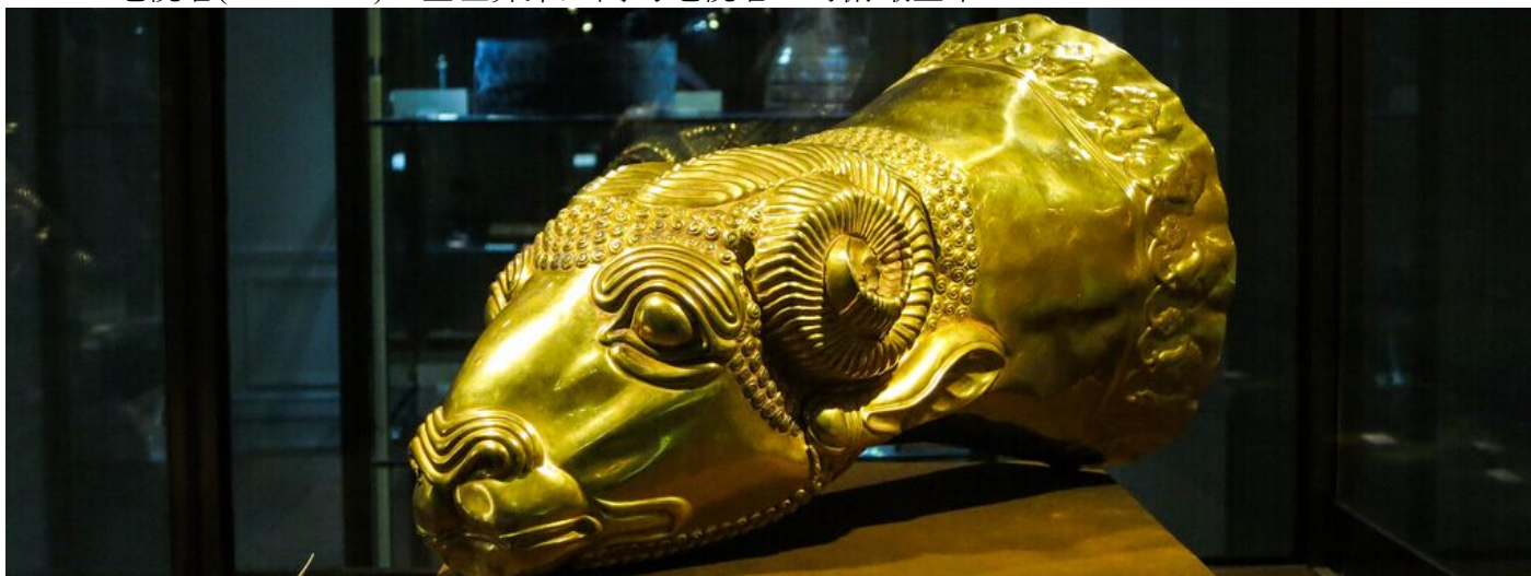
<禮薩阿巴斯博物館>