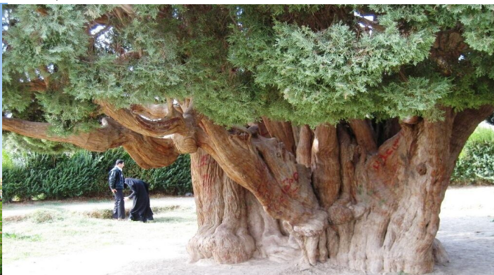
<阿巴庫的五千年柏樹>